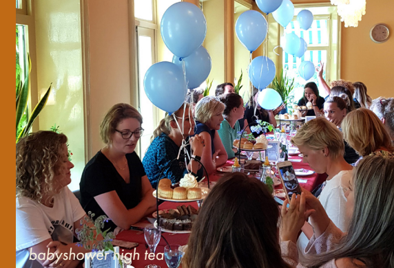
babyshower high tea