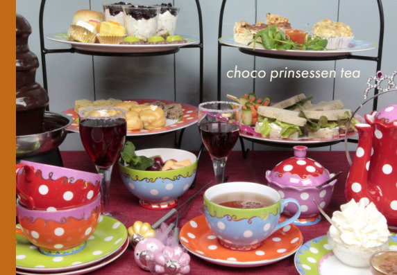
choco prinsessen tea

De Babyshower High Tea is een uitgebreide, extra feestelijk aangeklede Afternoon Tea. Voor meer info, zie theefabriek.nl/babyshower-high-tea .